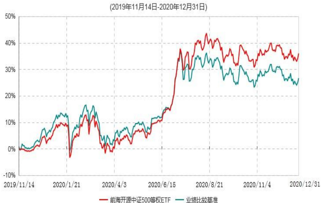
前海开源中证500等权重交易型开放式指数证券投资基金累计净值增长率与业绩比较基准收益率历史走势对比图

注：本基金的建仓期为6个月，建仓期结束时各项资产配置比例符合基金合同规定。截至2020年12月31日，本基金距建仓结束日未满一年。