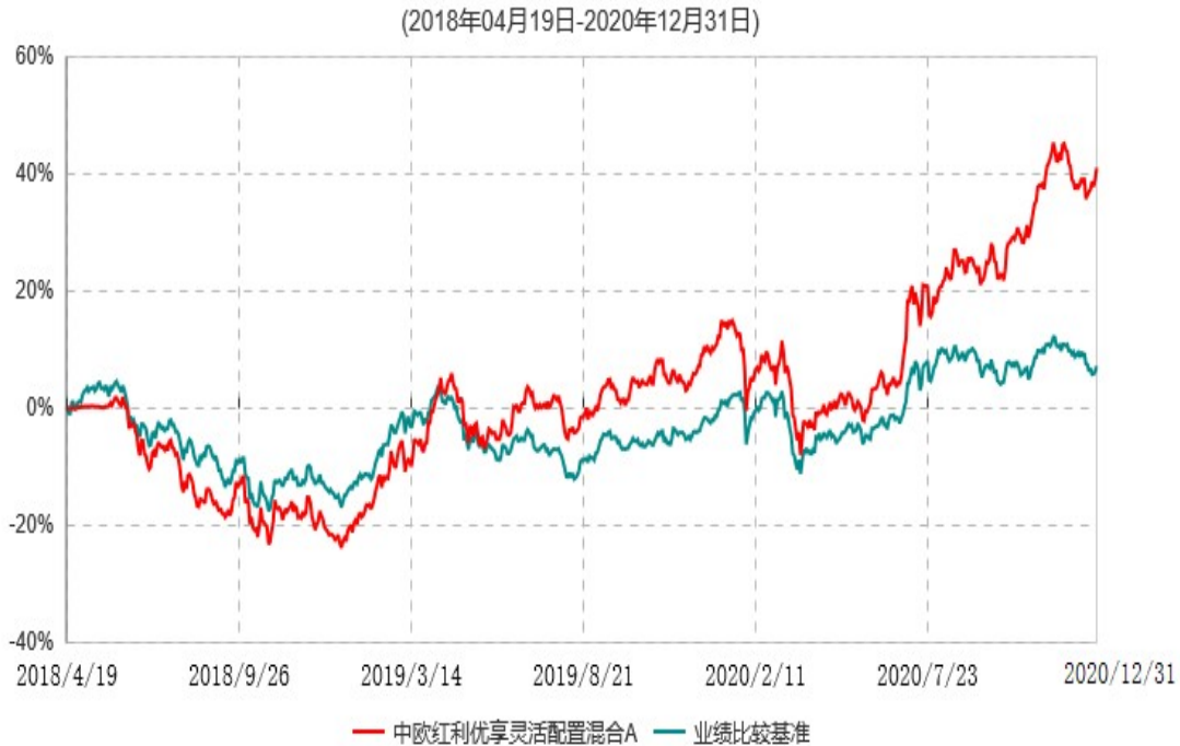
中欧红利优享灵活配置混合A累计净值增长率与业绩比较基准收益率历史走势对比图