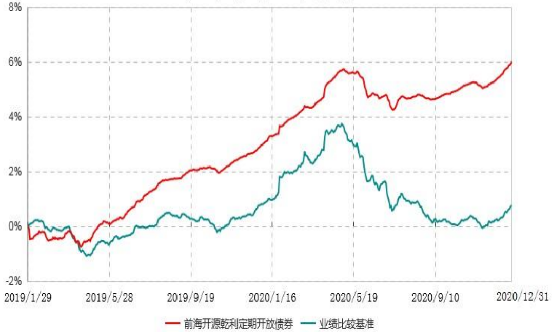
前海开源乾利3个月定期开放债券型发起式证券投资基金累计净值增长率与业绩比较基准收益率历史走势对比图 (2019年01月29日-2020年12月31日)