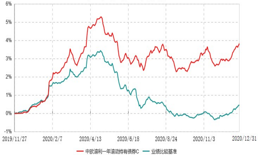
中欧滚利一年滚动持有债券C累计净值增长率与业绩比较基准收益率历史走势对比图 (2019年11月27日-2020年12月31日)

注：本基金基金合同生效日期为 2019 年 11 月 27 日，按基金合同的规定，本基金自基金合同生效起六个月为建仓期，建仓期结束时各项资产配置比例已符合基金合同约定。