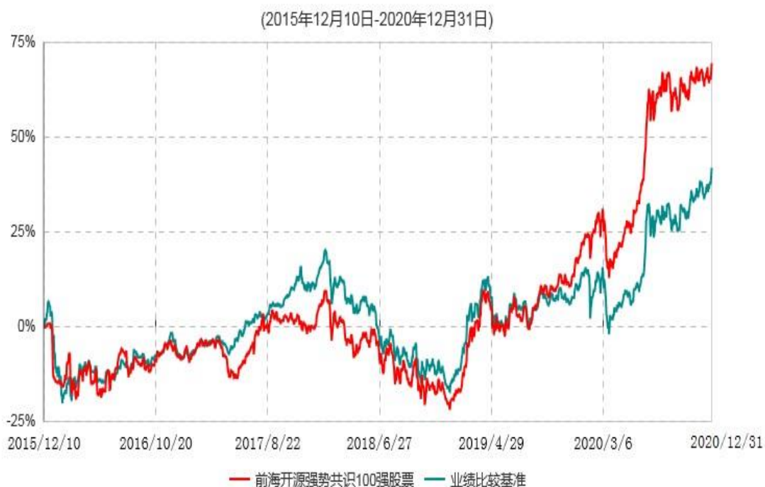
前海开源强势共识100强等权重股票型证券投资基金累计净值增长率与业绩比较基准收益率历史走势对比图