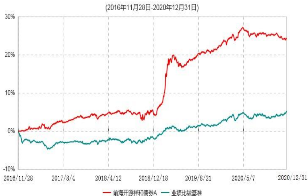
前海开源祥和债券A累计净值增长率与业绩比较基准收益率历史走势对比图