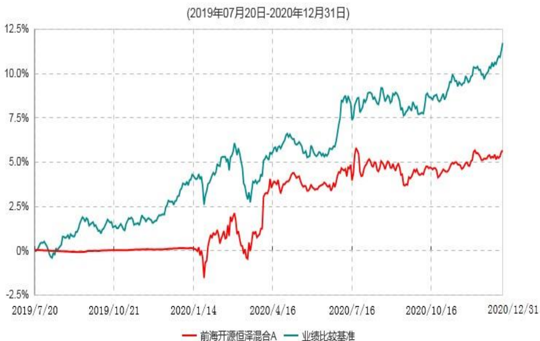
前海开源恒泽混合A累计净值增长率与业绩比较基准收益率历史走势对比图