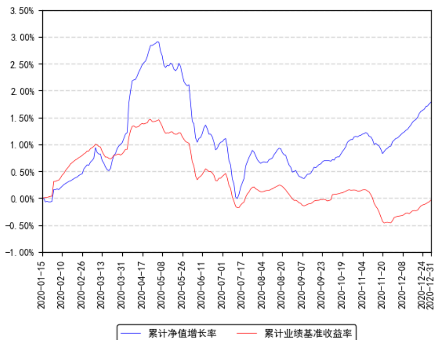
南方宁利一年定开债券发起累计净值增长率与同期业绩比较基准收益率的历史走势对比图

注：本基金合同于2020年1月15日生效，截至本报告期末基金成立未满一年；自基金成立日起6个月内为建仓期，建仓期结束时各项资产配置比例符合合同约定。