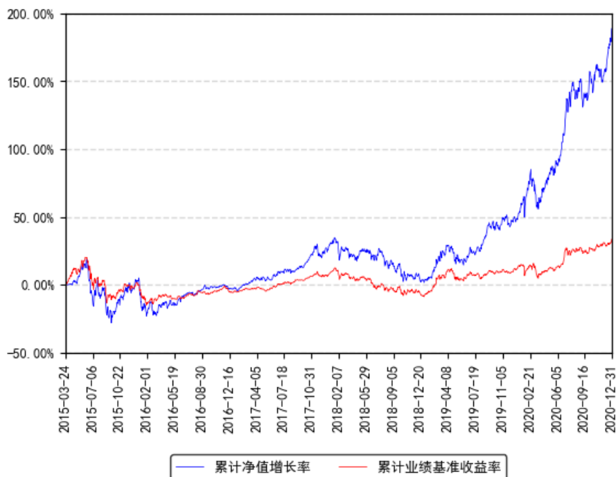
南方创新经济灵活配置混合累计净值增长率与同期业绩比较基准收益率的历史走势对比图