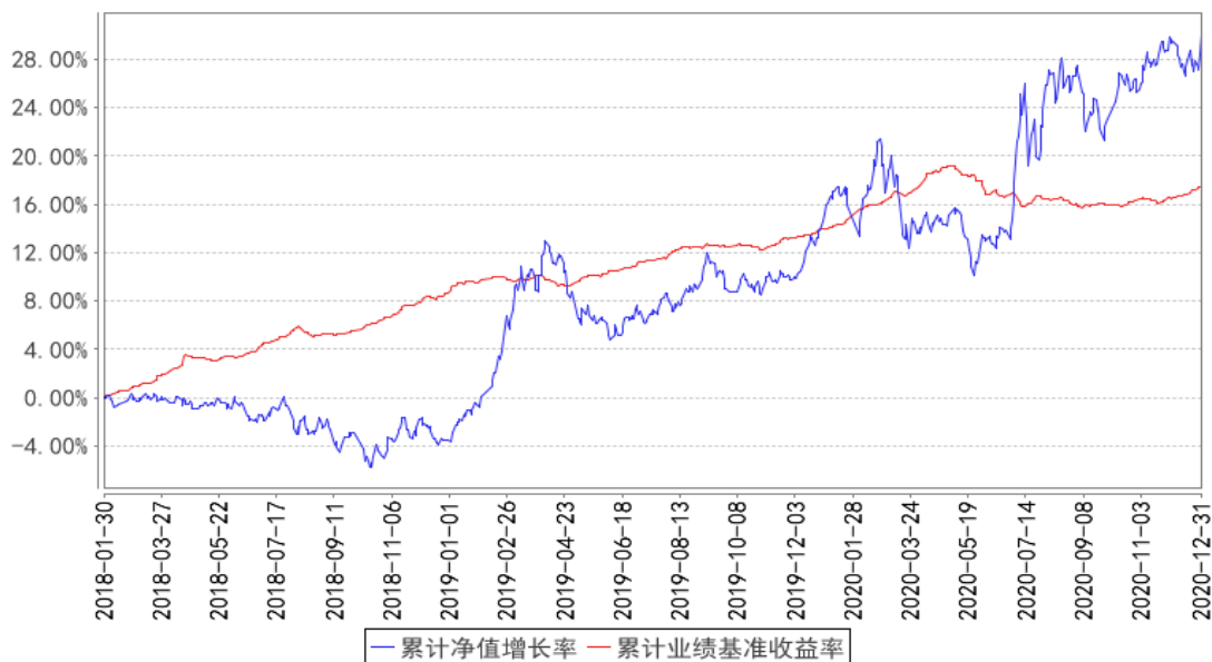
华富安享债券累计净值增长率与同期业绩比较基准收益率的历史走势对比图

注：本基金转型前为华富安享保本混合型证券投资基金。根据《华富安享债券型证券投资基金基金合同》的规定，本基金的资产配置范围为：债券资产的比例不低于基金资产的 80%，股票、权证等权益类资产比例不超过基金资产的 20%，其中，本基金持有的全部权证，其市值不得超过基金资产净值的 3%；投资于现金或者到期日在一年以内的政府债券不低于基金资产净值的 5%，其中现金不包括结算备付金、存出保证金及应收申购款等。本基金建仓期为 2018 年 1 月 30 日到 2018 年 7 月 30 日，建仓期结束时各项资产配置比例符合合同约定。本报告期内，本基金严格执行了《华富安享债券型证券投资基金基金合同》的相关规定。