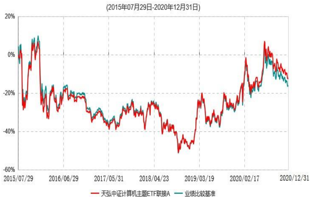
天弘中证计算机主题ETF联接A累计净值增长率与业绩比较基准收益率历史走势对比图