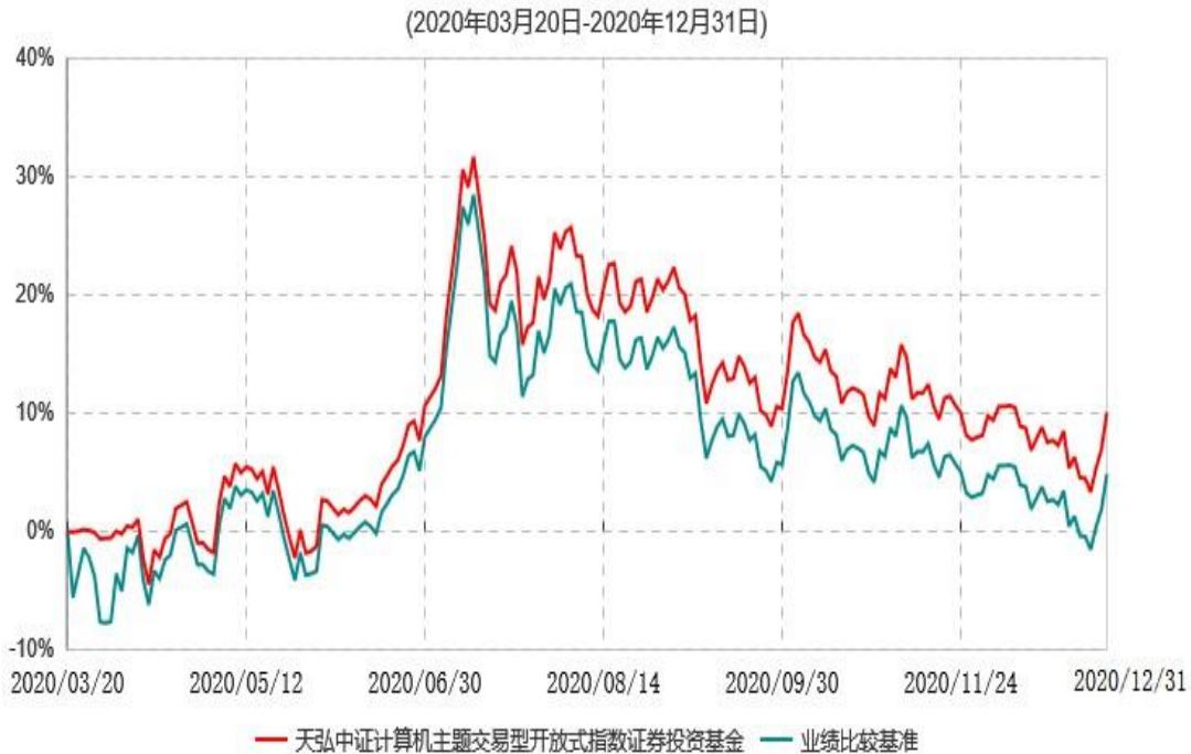
天弘中证计算机主题交易型开放式指数证券投资基金累计净值增长率与业绩比较基准收益率历史走势对比图