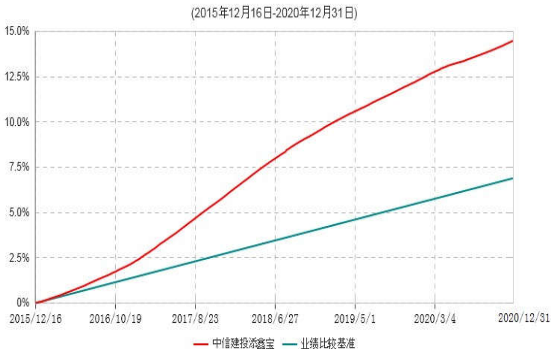
中信建投添鑫宝货币市场基金累计净值收益率与业绩比较基准收益率历史走势对比图