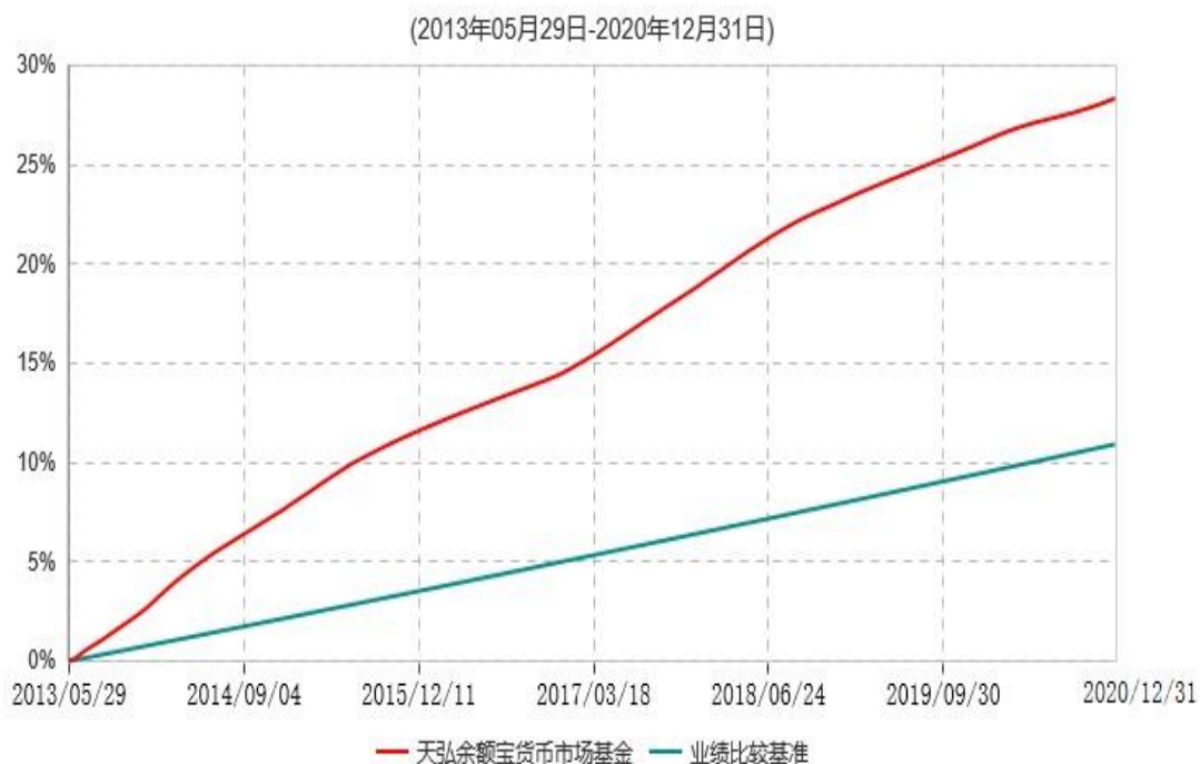
天弘余额宝货币市场基金累计净值收益率与业绩比较基准收益率历史走势对比图