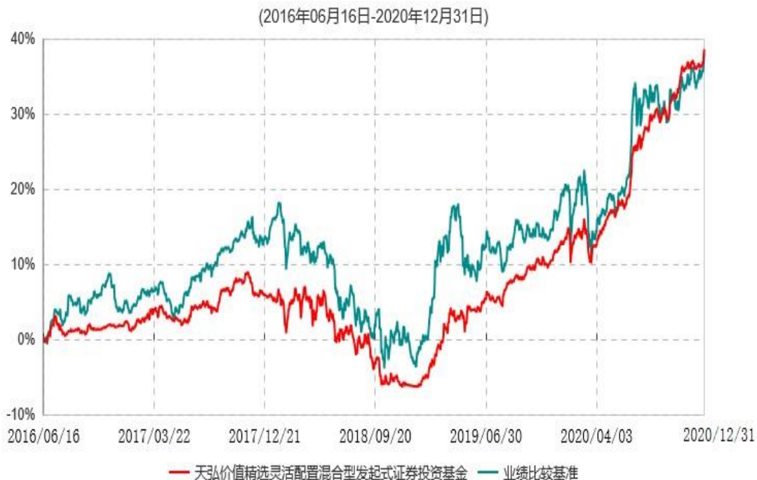
天弘价值精选灵活配置混合型发起式证券投资基金累计净值增长率与业绩比较基准收益率历史走势对比图