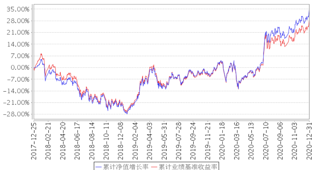
平安沪深300ETF累计净值增长率与同期业绩比较基准收益率的历史走势对比图