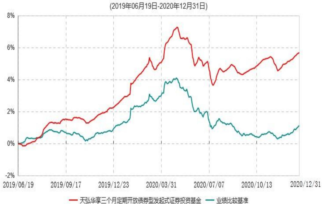
天弘华享三个月定期开放债券型发起式证券投资基金累计净值增长率与业绩比较基准收益率历史走势对比图