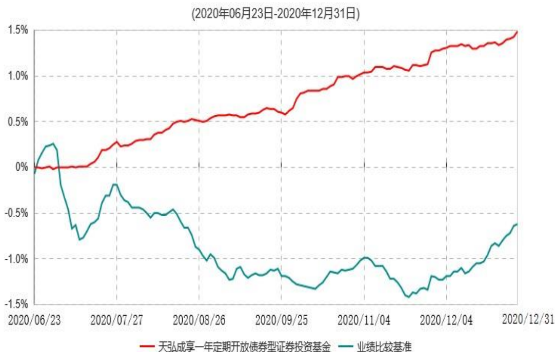
天弘成享一年定期开放债券型证券投资基金累计净值增长率与业绩比较基准收益率历史走势对比图

注：1、本基金合同于2020年06月23日生效，本基金合同生效起至披露时点不满1年。