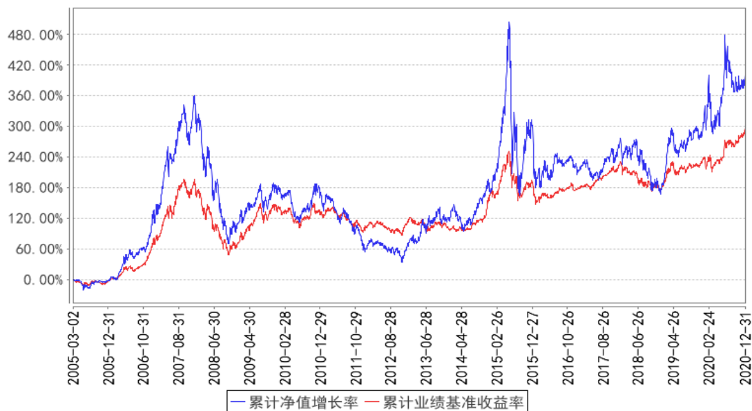
华富竞争力优选混合累计净值增长率与同期业绩比较基准收益率的历史走势对比图

注：1、根据《华富竞争力优选混合型证券投资基金基金合同》的规定，本基金的资产配置范围为：股票 30%~90%、债券 5%~65%、现金不低于基金资产净值的 5%。本基金建仓期为 2005 年 3 月 2 日至 9 月 2 日，建仓期结束时各项资产配置比例符合合同约定。本报告期内，本基金严格执行了《华富竞争力优选混合型证券投资基金基金合同》的相关规定。