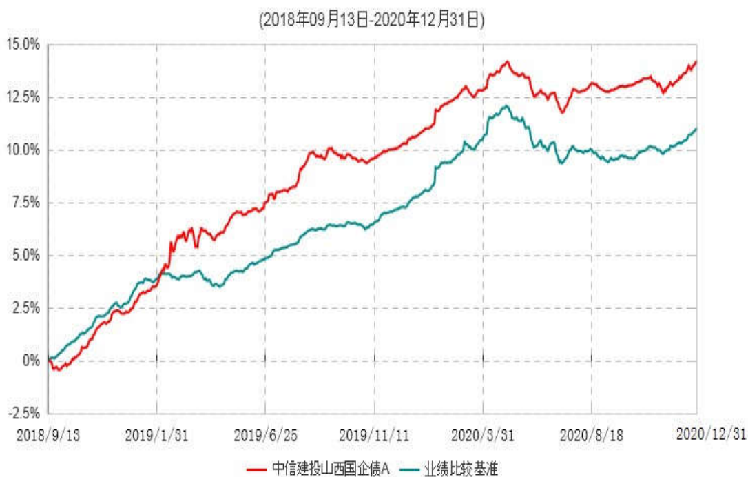
中信建投山西国企债A累计净值增长率与业绩比较基准收益率历史走势对比图