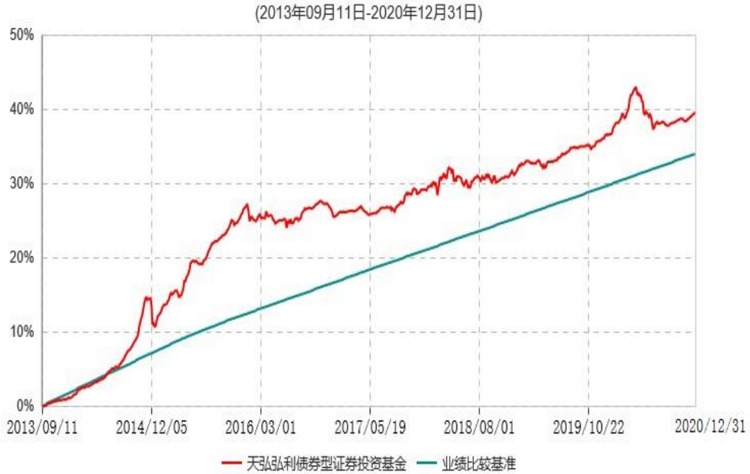
天弘弘利债券型证券投资基金累计净值增长率与业绩比较基准收益率历史走势对比图