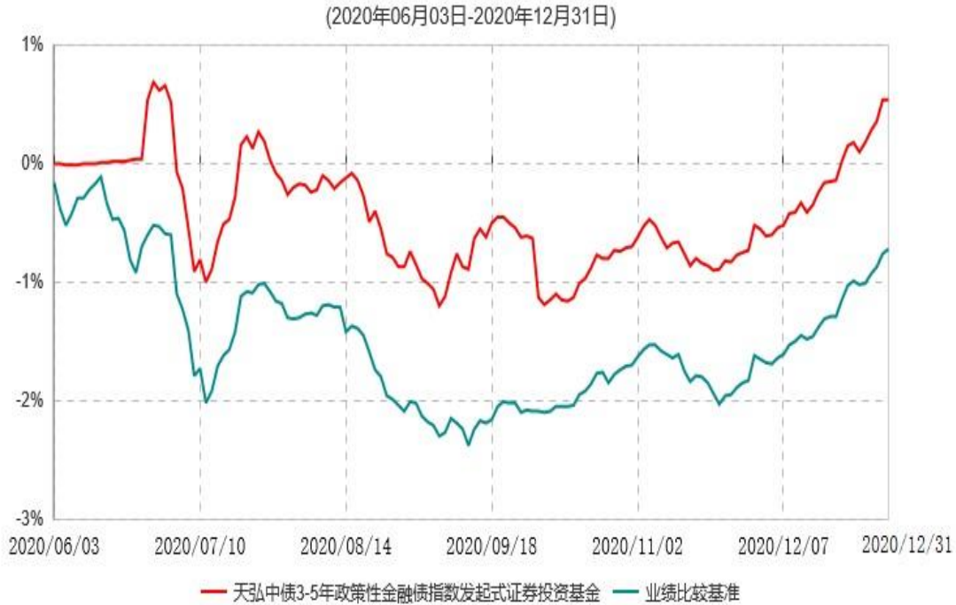
天弘中债3-5年政策性金融债指数发起式证券投资基金累计净值增长率与业绩比较基准收益率历史走势对比图

注：1、本基金合同于2020年06月03日生效，本基金合同生效起至披露时点不满1年。