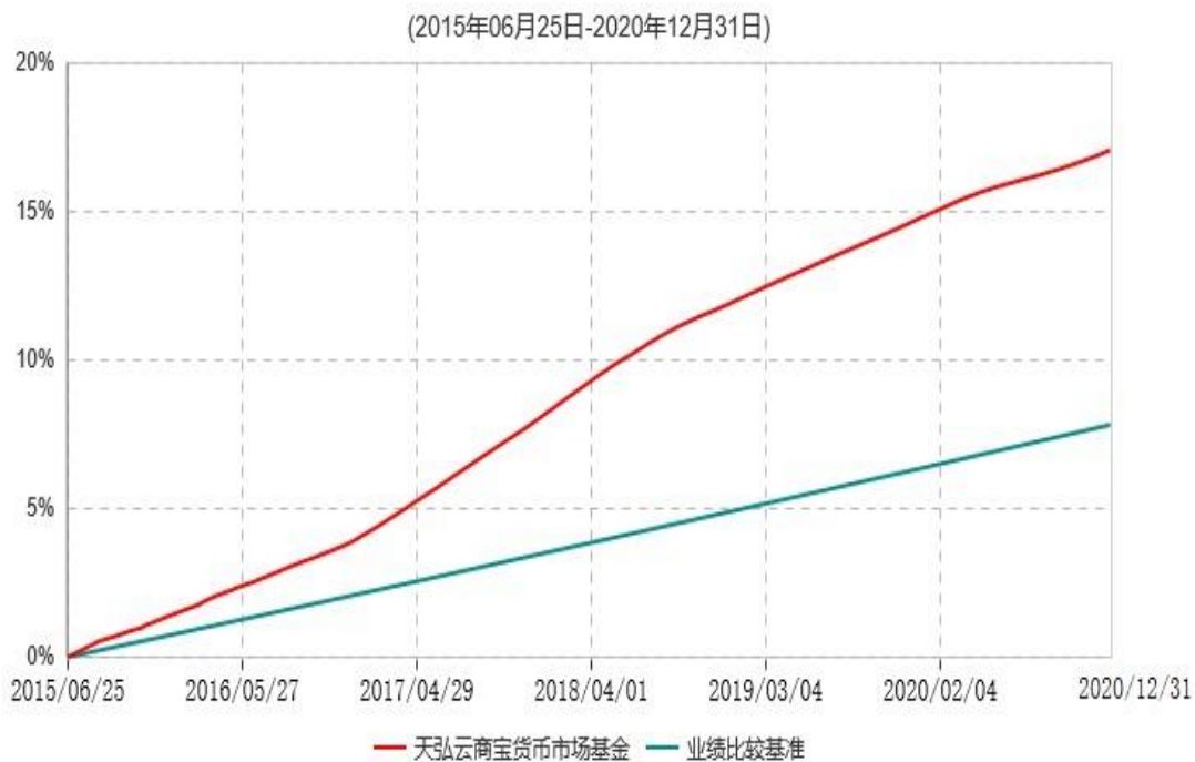
天弘云商宝货币市场基金累计净值收益率与业绩比较基准收益率历史走势对比图