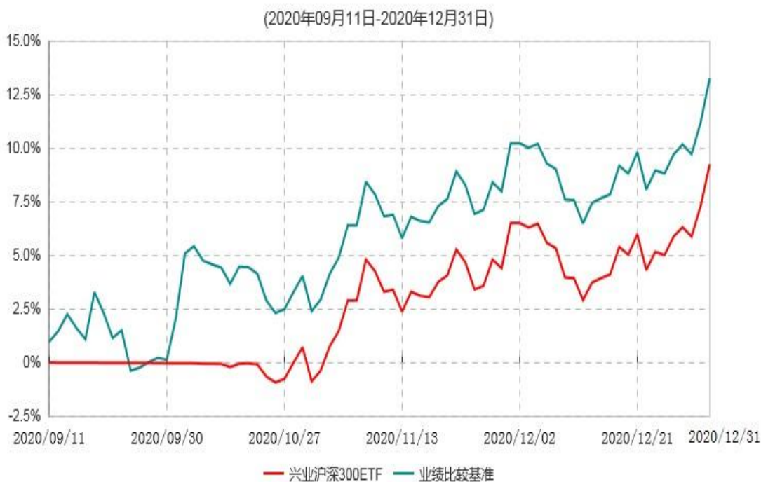
兴业沪深300交易型开放式指数证券投资基金累计净值增长率与业绩比较基准收益率历史走势对比图

注：1、本基金基金合同于2020年9月11日生效，截至报告期末本基金基金合同生效未满一年。