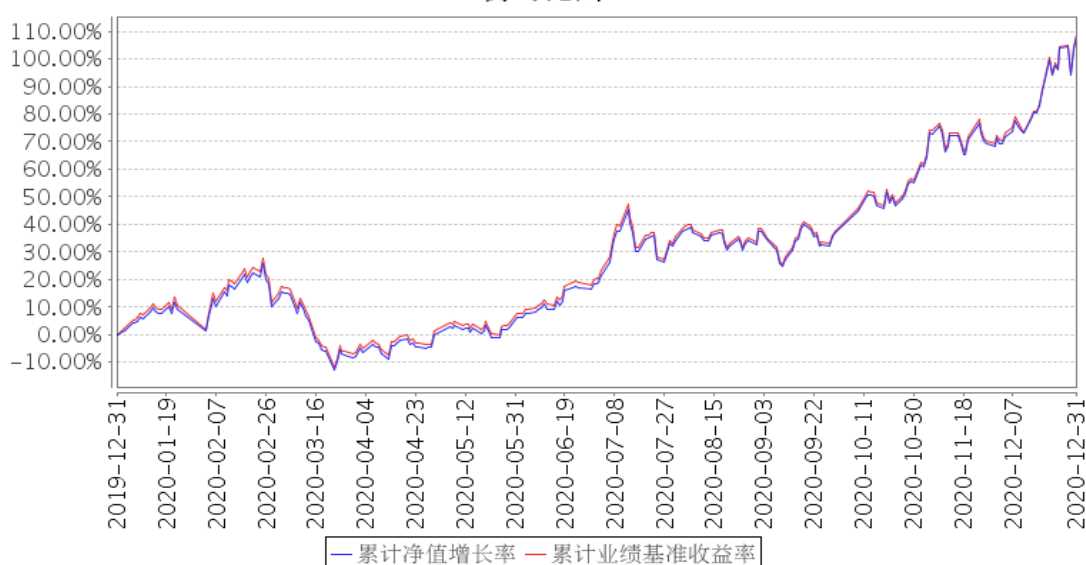
平安中证新能源汽车产业ETF累计净值增长率与同期业绩比较基准收益率的历史走势对比图