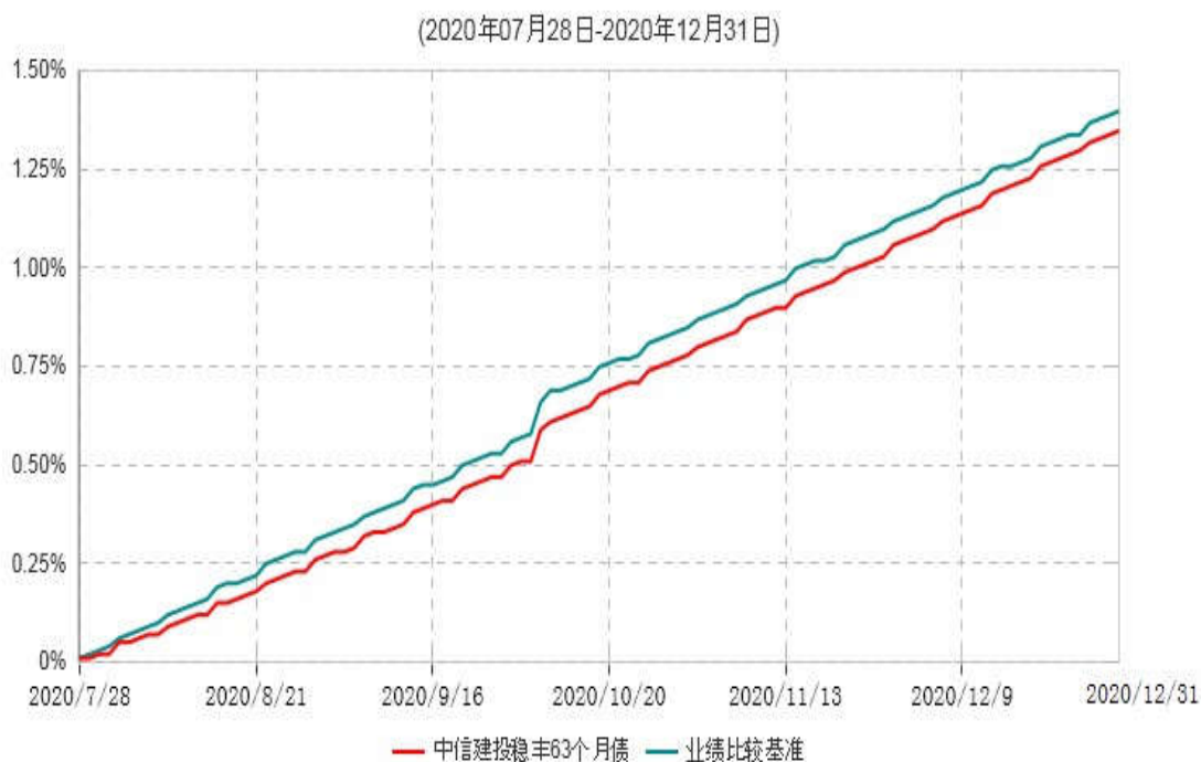
中信建投稳丰63个月定期开放债券型证券投资基金累计净值增长率与业绩比较基准收益率历史走势对比图

注：1、本基金基金合同生效于2020年7月28日，截至报告期末本基金基金合同生效未满一年。