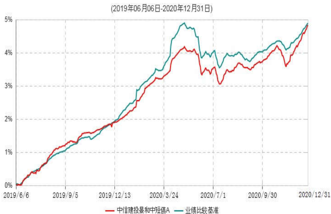
中信建投景和中短债A累计净值增长率与业绩比较基准收益率历史走势对比图