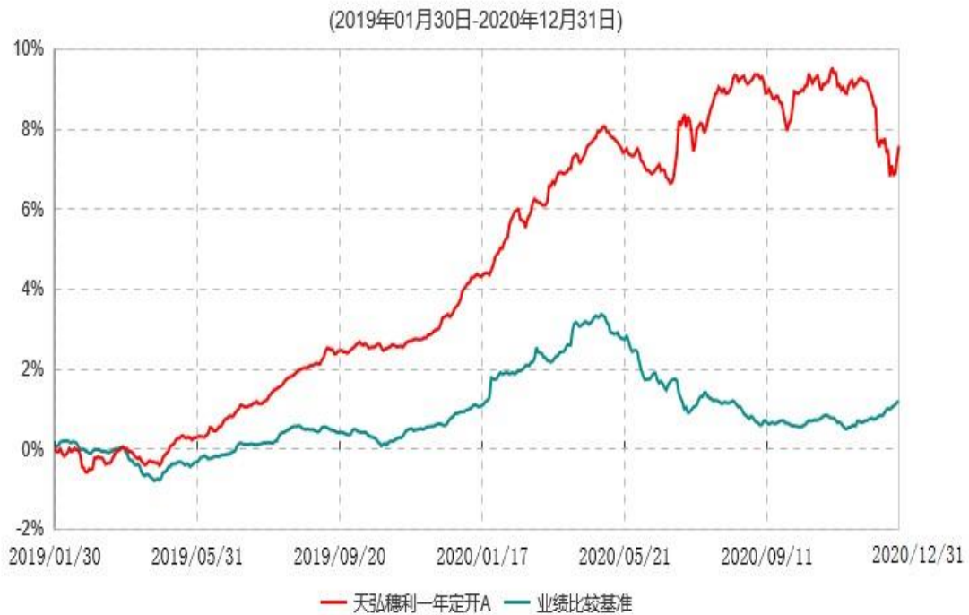
天弘穗利一年定开A累计净值增长率与业绩比较基准收益率历史走势对比图