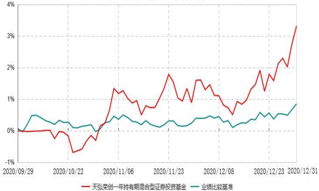
天弘荣创一年持有期混合型证券投资基金累计净值增长率与业绩比较基准收益率历史走势对比图 (2020年09月29日-2020年12月31日)

注：1、本基金合同于2020年09月29日生效，本基金合同生效起至披露时点不满1年。