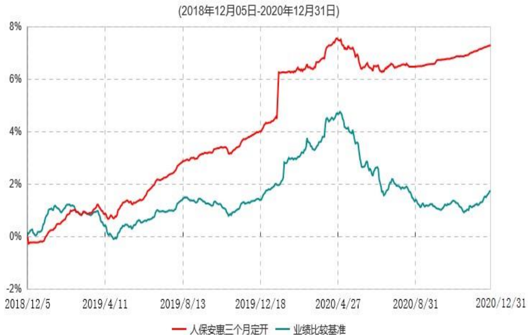
人保安惠三个月定期开放债券型发起式证券投资基金累计净值增长率与业绩比较基准收益率历史走势对比图

注：1、本基金基金合同于2018年12月5日生效。根据基金合同规定，本基金建仓期为6个月，建仓期满，本基金的各项投资比例符合基金合同的有关约定。