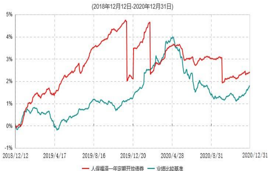
人保福泽纯债一年定期开放债券型证券投资基金累计净值增长率与业绩比较基准收益率历史走势对比图

注：1、本基金基金合同于2018年12月12日生效。根据基金合同规定，本基金建仓期为6个月，建仓期满，本基金的各项投资比例符合基金合同的有关约定。