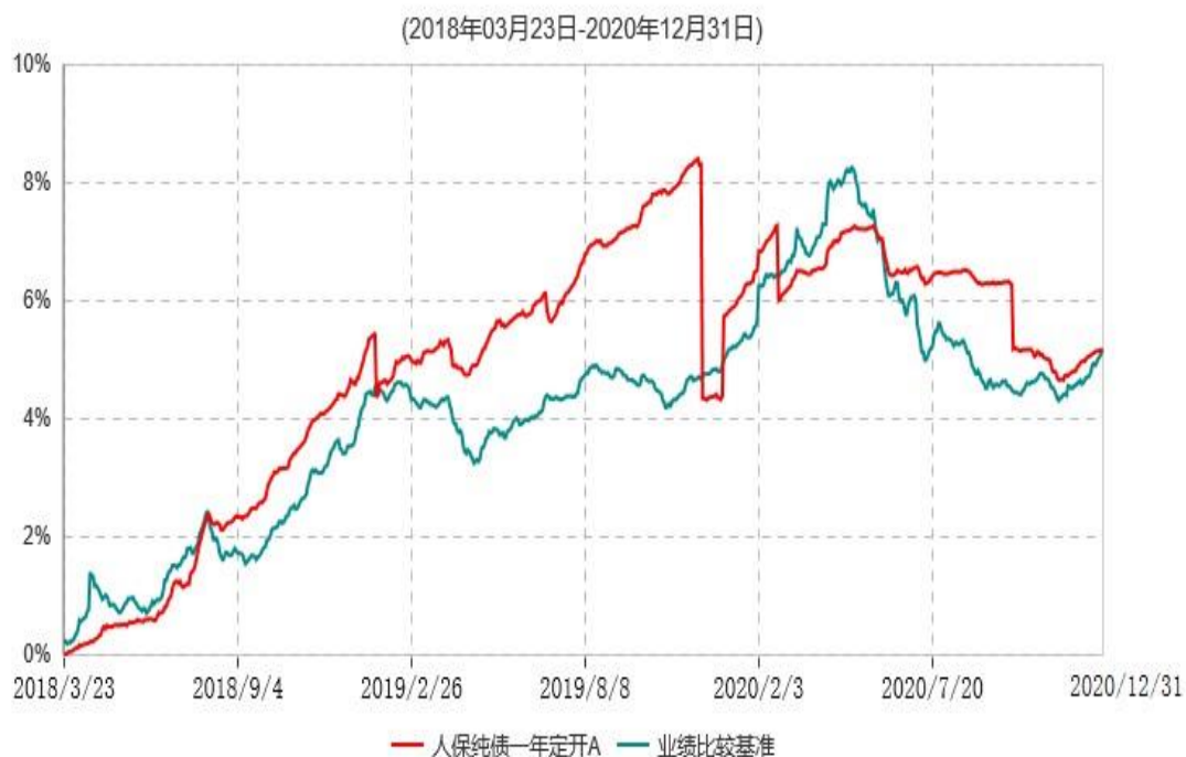
人保纯债一年定开A累计净值增长率与业绩比较基准收益率历史走势对比图