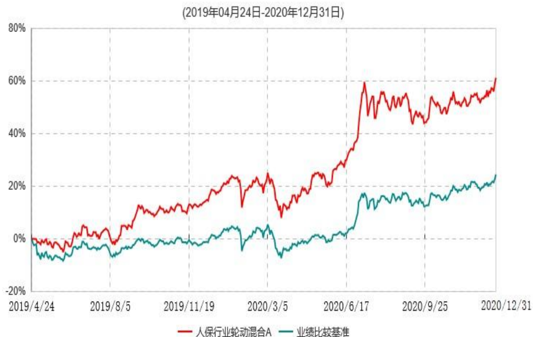
人保行业轮动混合A累计净值增长率与业绩比较基准收益率历史走势对比图