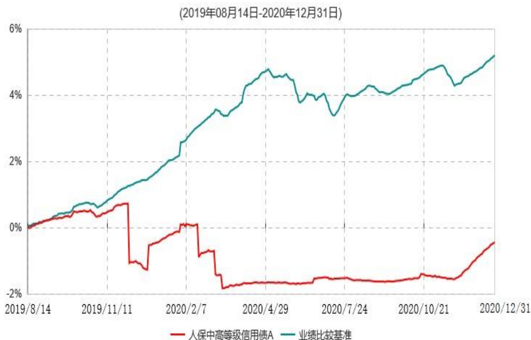
人保中高等级信用债A累计净值增长率与业绩比较基准收益率历史走势对比图