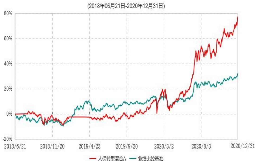
人保转型混合A累计净值增长率与业绩比较基准收益率历史走势对比图