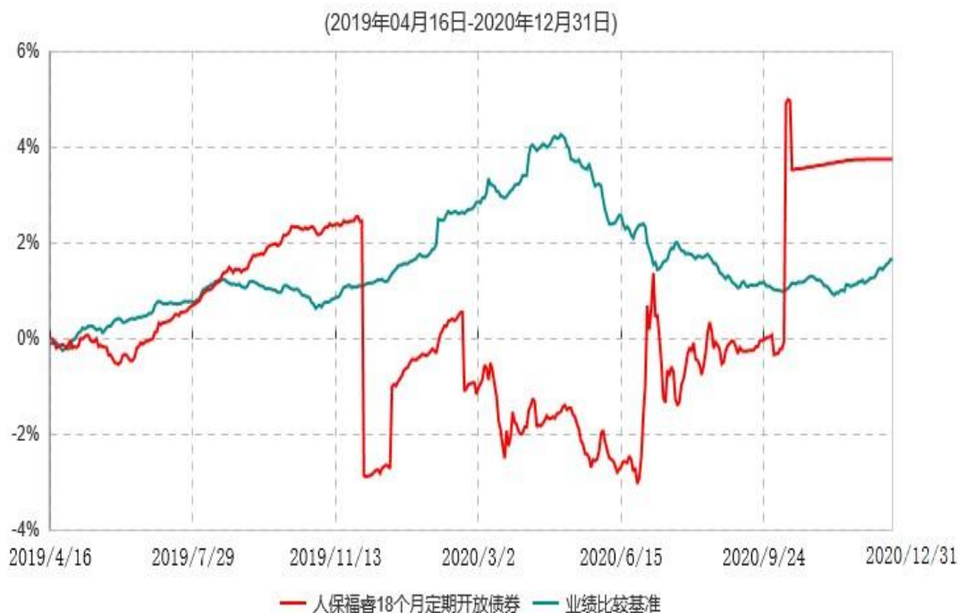
人保福睿18个月定期开放债券型证券投资基金累计净值增长率与业绩比较基准收益率历史走势对比图

注：1、本基金基金合同于2019年4月16日生效。根据基金合同规定，本基金建仓期为6个月，建仓期满，本基金的各项投资比例符合基金合同的有关约定。 2、本基金业绩比较基准为：中债综合全价(总值)指数收益率*90%+一年期银行定期存款利率(税后)*10%