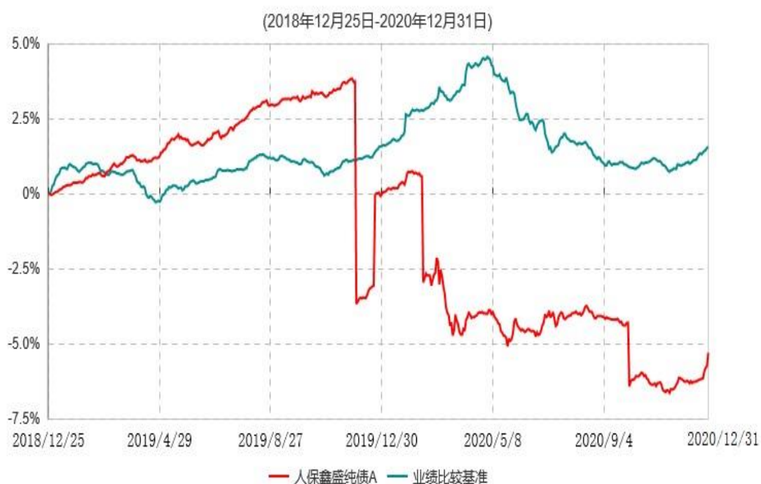
人保鑫盛纯债A累计净值增长率与业绩比较基准收益率历史走势对比图