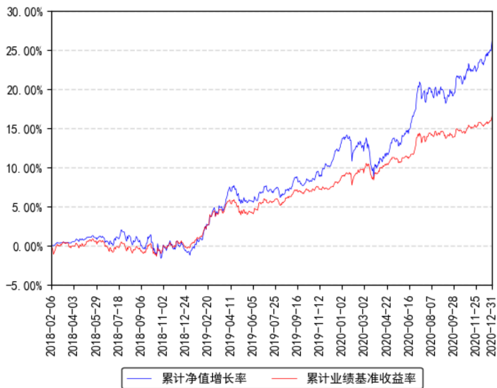
南方安养混合累计净值增长率与同期业绩比较基准收益率的历史走势对比图