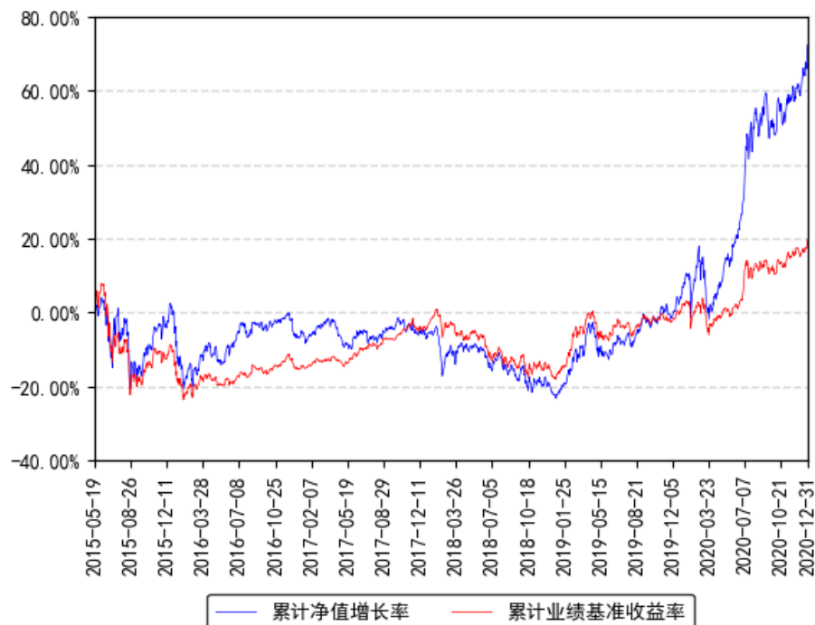
南方改革机遇灵活配置混合累计净值增长率与同期业绩比较基准收益率的历史走势对比图