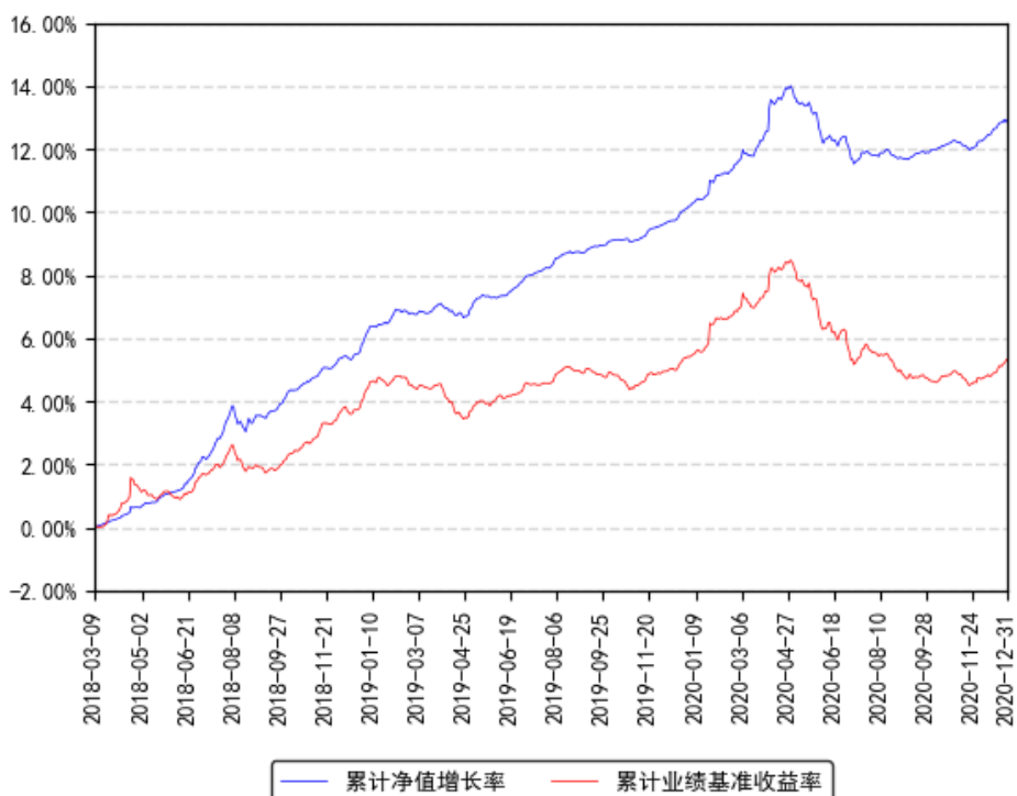
南方乾利定开债券发起累计净值增长率与同期业绩比较基准收益率的历史走势对比图