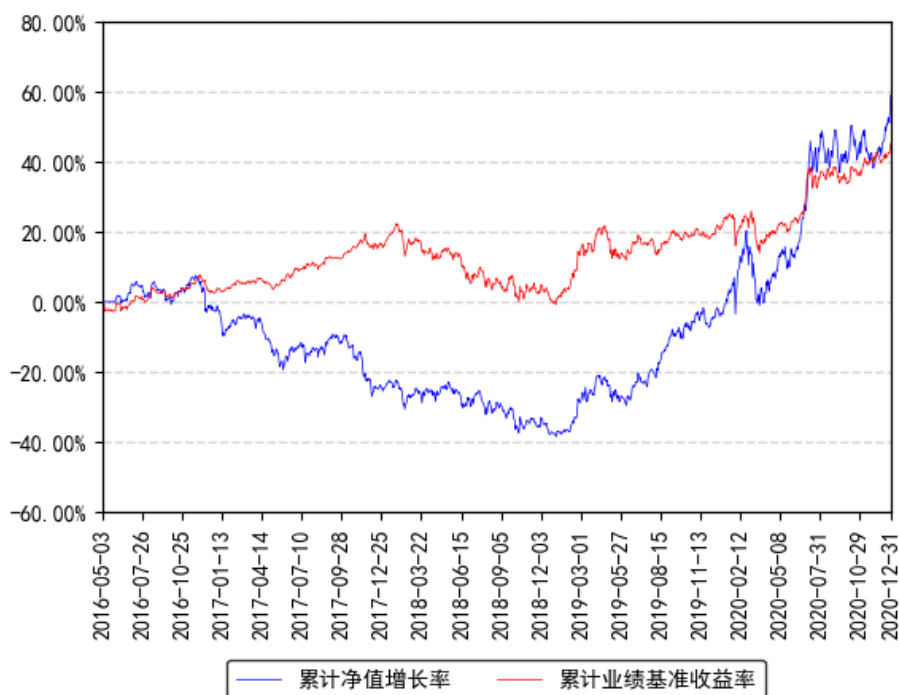
南方新兴龙头灵活配置混合累计净值增长率与同期业绩比较基准收益率的历史走势对比图