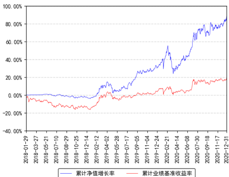
南方融尚再融资主题精选灵活配置混合累计净值增长率与同期业绩比较基准收益率的历史走势对比图