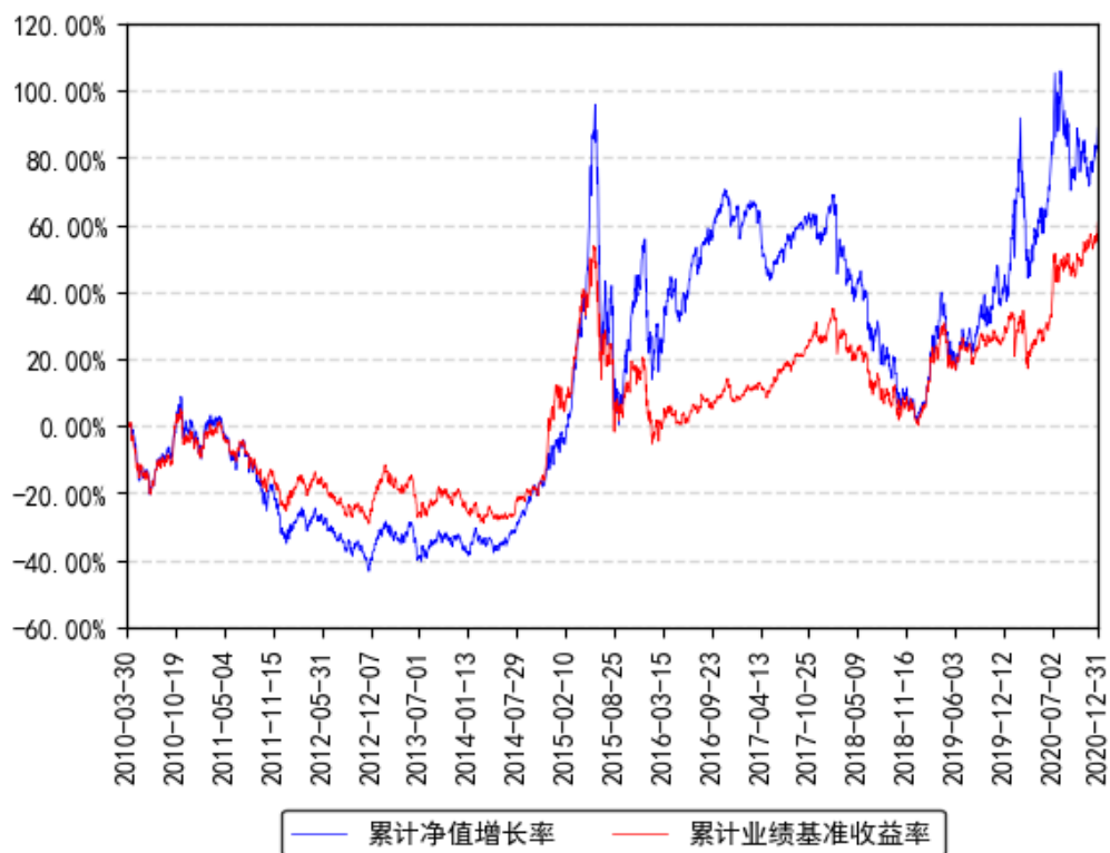
南方策略优化混合累计净值增长率与同期业绩比较基准收益率的历史走势对比图