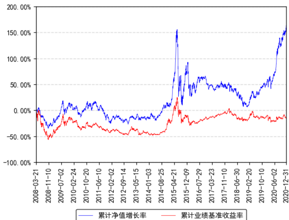
南方盛元红利混合累计净值增长率与同期业绩比较基准收益率的历史走势对比图