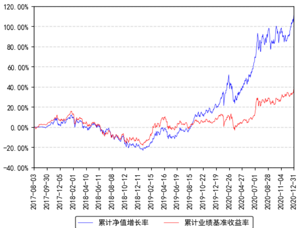
南方智造未来股票累计净值增长率与同期业绩比较基准收益率的历史走势对比图