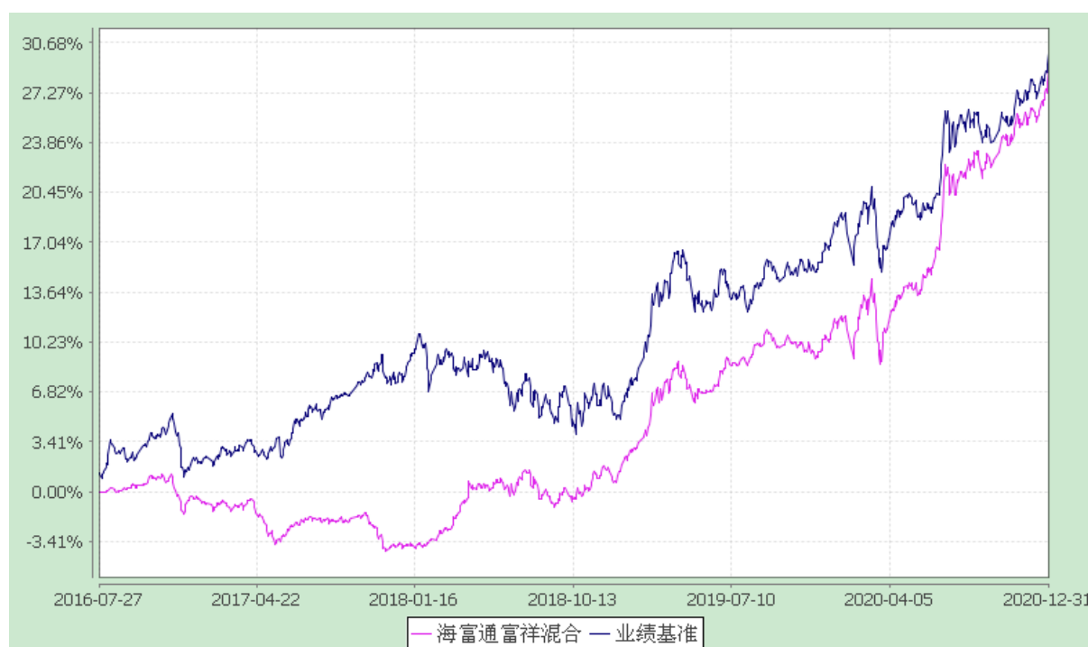
海富通富祥混合型证券投资基金 份额累计净值增长率与业绩比较基准收益率的历史走势对比图 (2016年7月27日至2020年12月31日)

注：本基金合同于2016年7月27日生效，按基金合同规定，本基金自基金合同生效起6个月内为建仓期。建仓期结束时本基金的各项投资比例已达到基金合同第十二部分（二）投资范围、（四）投资限制中规定的各项比例。