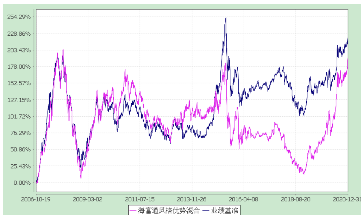
海富通风格优势混合型证券投资基金 份额累计净值增长率与业绩比较基准收益率的历史走势对比图 (2006 年 10 月 19 日至 2020 年 12 月 31 日)

注：1.根据基金合同规定,本基金自基金合同生效起 6 个月内为建仓期,即 2006 年 10 月 19 日至 2007 年 4 月 18 日。建仓期满至今,本基金的各项投资比例应达到基金合同第十二条(二)、(六)中规定的比例限制及本基金投资组合的比例范围。 2.为了能更公允地体现基金投资业绩,海富通基金管理有限公司自 2007 年 1 月 1 日起调整海富通风格优势基金业绩比较基准中股票部分的基准。原比较基准中的上证指数将调整为 MSCI China A 指数,相应的基准权重不变。