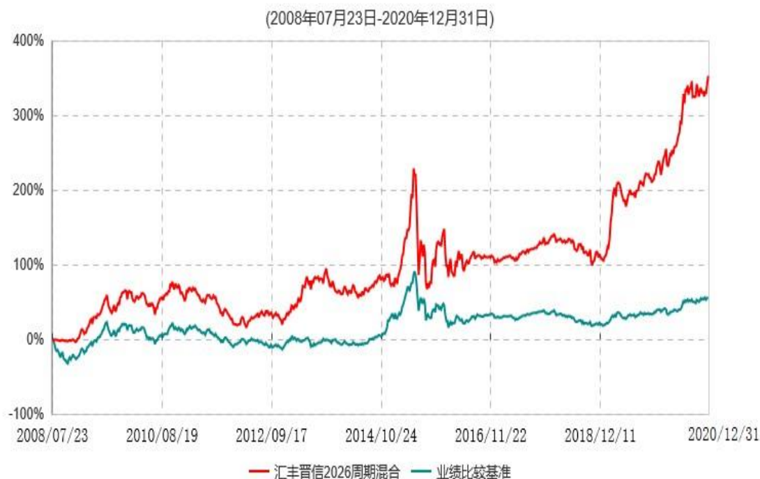
汇丰晋信2026生命周期证券投资基金累计净值增长率与业绩比较基准收益率历史走势对比图