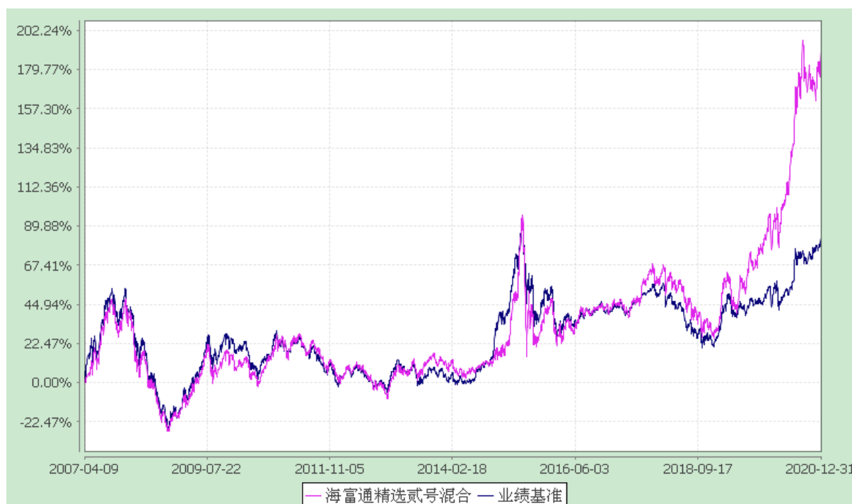
海富通精选贰号混合型证券投资基金 份额累计净值增长率与业绩比较基准收益率的历史走势对比图 (2007 年 4 月 9 日至 2020 年 12 月 31 日)

注：按基金合同规定,本基金自基金合同生效起 6 个月内为建仓期,建仓期满至今本基金的各项投资比例已达到基金合同有关投资范围的规定,即股票投资 50%-80%,债券投资 20%-50%,权证投资 0-3%;并保持不低于基金资产净值 5%的现金或者到期日在一年以内的政府债券。同时满足第 14 章(七)有关投资组合限制的各项比例要求。