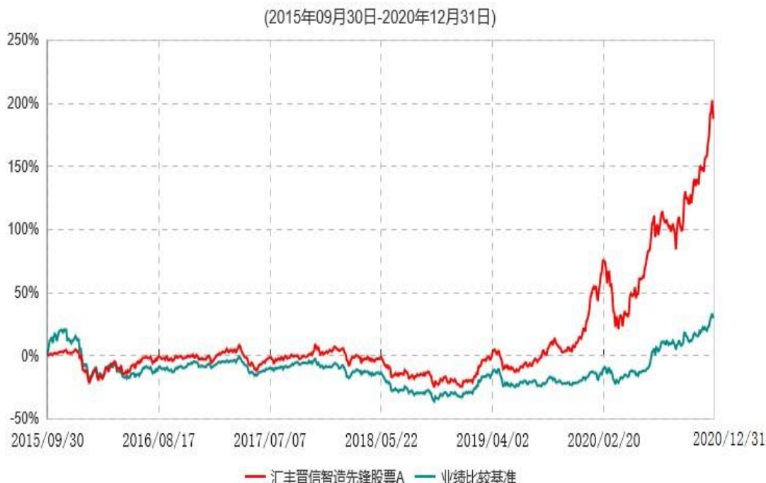
汇丰晋信智造先锋股票A累计净值增长率与业绩比较基准收益率历史走势对比图