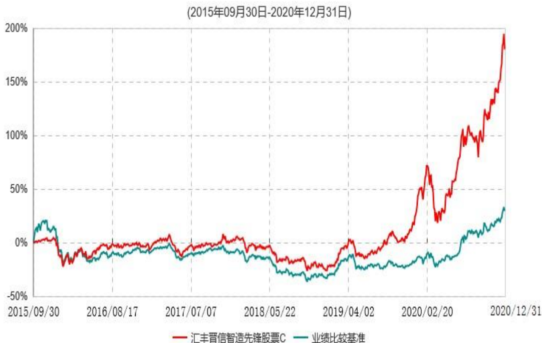
汇丰晋信智造先锋股票C累计净值增长率与业绩比较基准收益率历史走势对比图